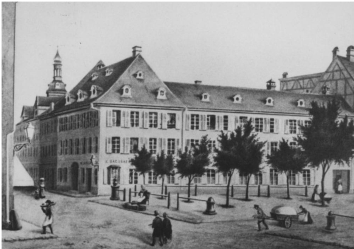
Foto: Baedeker-Haus um 1840.

Text entnommen: Mythos Baedeker: Karl Baedeker und sein Verlagshaus in Koblenz. Ausstellung im Landesbibliothekszentrum / Rheinische Landesbibliothek vom 9. Oktober bis 30. November 2009