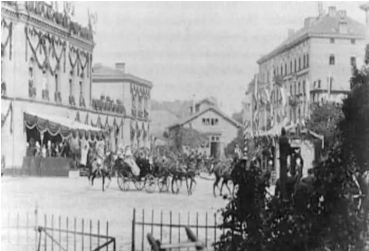
Unten: Ankunft Kaiser Wilhelm II. und Kaiserin Auguste Victoria 1.9.1893.